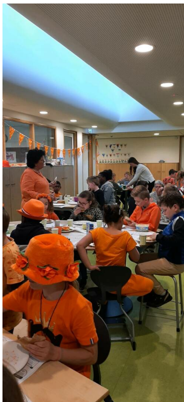
Met zijn allen genieten van het Koningsdag ontbijt